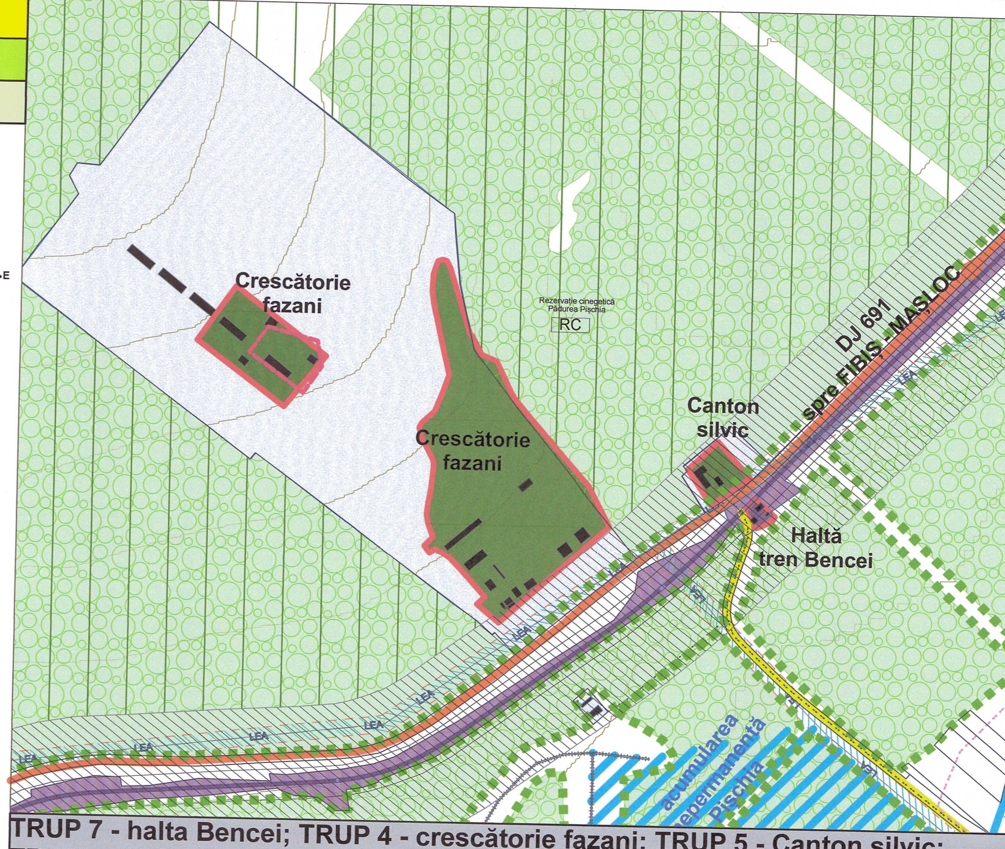
TRUP 7 - halta Bencei; TRUP 4 - crescătoria fazani; TRUP 5 - Canton silvic; TRUP 6 - crescătoria fazani